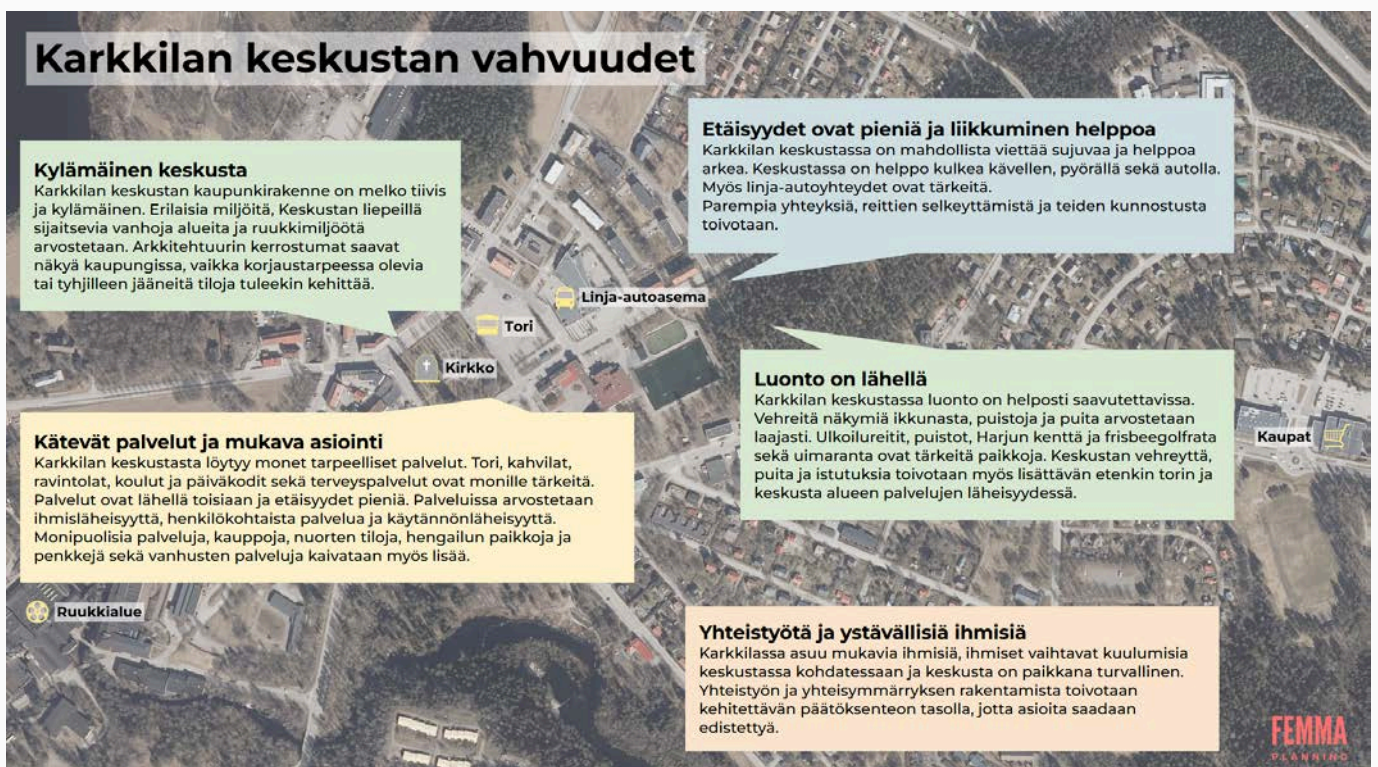
Kuva 5. Karkkilan keskustan vahvuudet visualisoituna

Kuvassa on esitettynä tärkeimmät Karkkilan keskustan vahvuudet keskustan ilmakuvakartan kanssa.