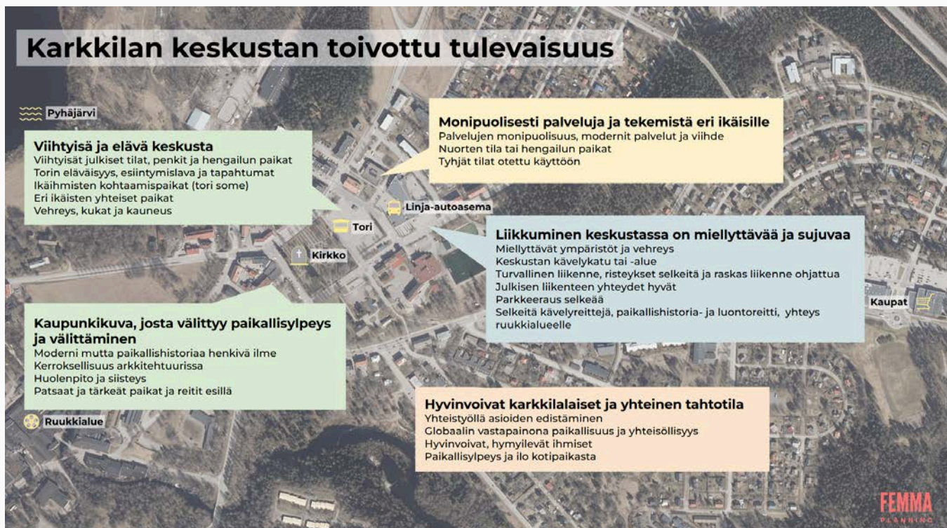
Kuva 8. Karkkilan keskustan toivottu tulevaisuus yhdellä silmäyksellä keskustan kanssa visualisoituna

Keskustan toivotusta tulevaisuudesta on koostettu tärkeimmät aiheet kustakin teemasta yhteen karttavisualisointiin.